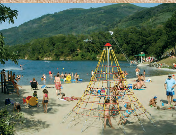
LA BASE NAUTIQUE

MERCUS • GARRABET • AMPLAING • JARNAT • CROQUIÉ