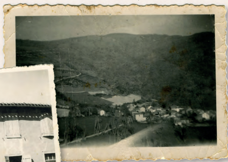
CROQUIÉ, LE VILLAGE AU DÉBUT DU 20 ème SIÈCLE