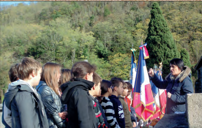
11 NOVEMBRE : LES ENFANTS CHANTENT LA MARSEILLAISE

MERCUS • GARRABET • AMPLAING • JARNAT • CROQUIÉ