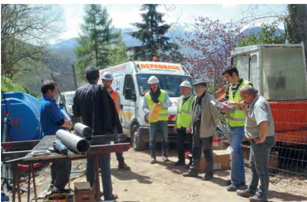
JARNAT - Réception des travaux de création d'un réseau assainissement et d'enfouissement des réseaux (électricité, téléphone, eau,...).