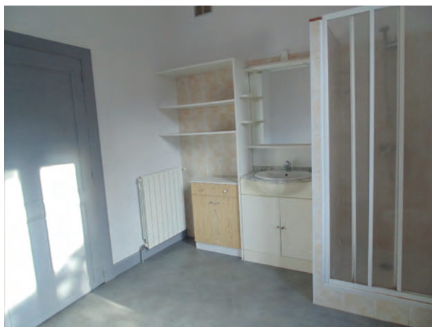
BATIMENTS - Rénovation de l'appartement locatif situé au dessus de l'ancienne école à Garrabet.