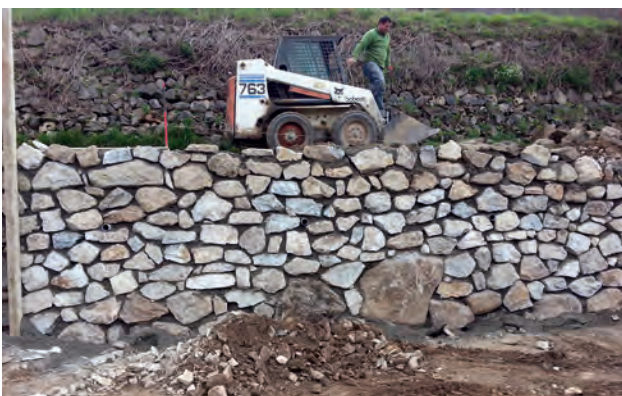
GARRABET - Chemin de Nougarède : remise en état du chemin détérioré par les intempéries 2014.