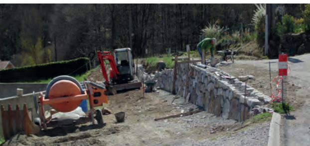
AMPLAING - Construction d'un mur de soutènement chemin du Communal, permettant l'élargissement de la voie.