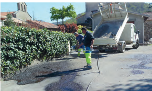
SUR L'ENSEMBLE DE LA COMMUNE : remise en état du revêtement des rues et des places.