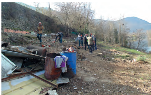
ENVIRONNEMENT - Nettoyage de la décharge sauvage située près de la cité "Péchiney" à Mercus.