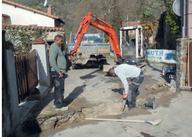
GARRABET - Rue de la Rivière : récupération des eaux de surface.