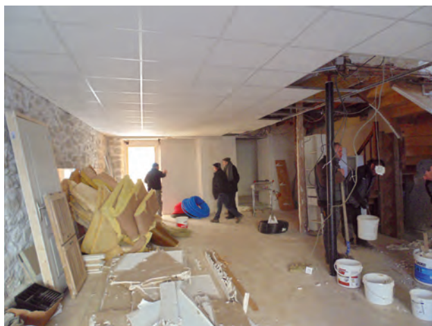
BATIMENTS - Aménagement de l'immeuble situé 27 avenue H. Marrot à Mercus (local commercial et appartement).