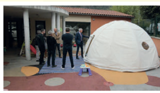
Les dix ans