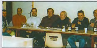
La Boule Lyonnaise un soir de novembre...