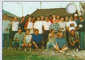
La Pétanque Mercusienne