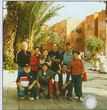
Le Maroc avec le Foyer Rural

ont le choix d'activités aussi diverses que l'informatique, la gymnastique, les sorties de ski de fond ou raquettes, la randonnée, les matches de foot et rugby, les voyages proches ou lointains.