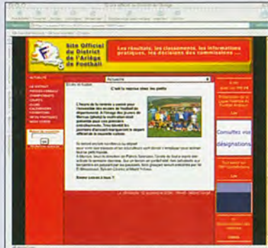
L'école de foot présente sur le site internet de la FFF, via le District de l'Ariège