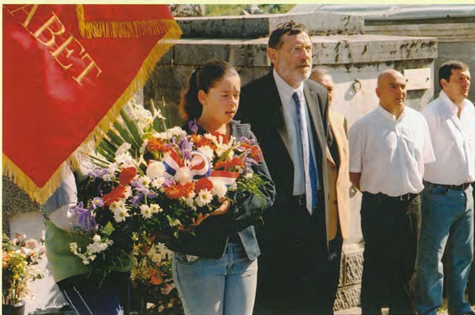
Un moment de recueillement ressenti par la jeunesse.