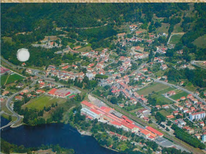
VUE AÉRIENNE DE MERCUS

MERCUS • GARRABET • AMPLAING • JARNAT • CROQUIÉ