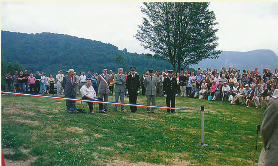
Les autorités civiles et militaires

Les aménagements réalisés sur ce promontoire permettent désormais d'accueillir les visiteurs et de leur offrir au-delà d'un paysage exceptionnel, un espace touristique entièrement aménagé (tables, bancs, fontaine, tables d'orientation) et l'espace commémoratif.