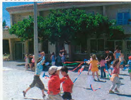
Vive le vent!