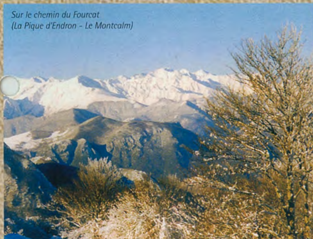
Sur le chemin du Fourcat (La Pique d'Endron - Le Montcalm)

MERCUS • GARRABET • AMPLAING • JARNAT • GROQUIÉ